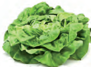
V zásuvce s udržovanou vyšší vlhkostí vzduchu

V kategorii lednic je spotřeba určitě důležitější než u praček nebo myček, které jsou po většinu své životnosti vypnuté a pouze zlomek času tráví praním či mytím. Přesto ani u chladniček není příliš podstatné, zda mají spotřebu o 20 kWh za rok vyšší či nižší, když některé nevytváří to nejlepší mikroklima pro skladování jídla. A je přeci rozdíl, jestli máte v zásuvce na zeleninu za dva dny zvadlý salát a scvrklé ředkvičky na vyhození, nebo i po deseti dnech vše svěží jako právě nakoupené. Nevyhození a zkonsumování těchto potravin je bezesporu pochybností důležitější než to, jestli vlastně model lednice s nejnižší spotřebou elektřiny na trhu. Jak je možné, že se jednotlivé lednice takto liší? To vám vysvětlíme na následujících stranách.