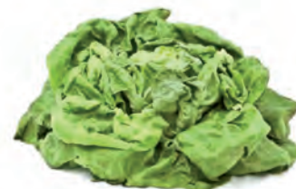
V běžné zásuvce na zeleninu